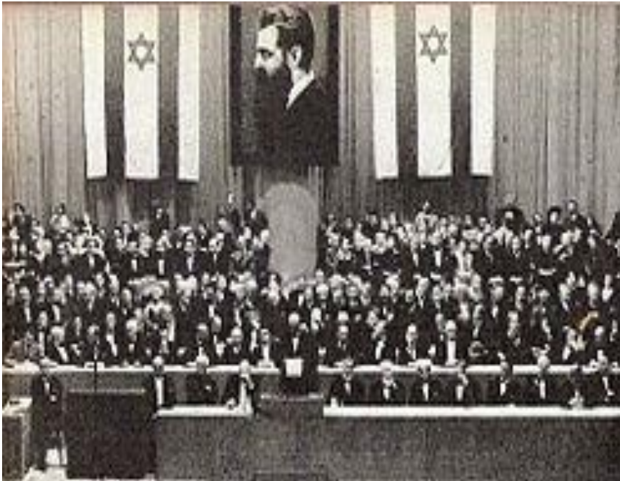
הקונגרס הציוני בבזל