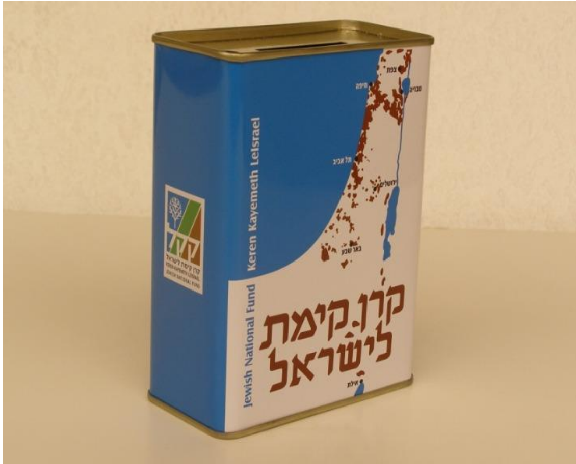
הקופסא הכחולה – סמלה של הקרן הקיימת מאז שנת 1901