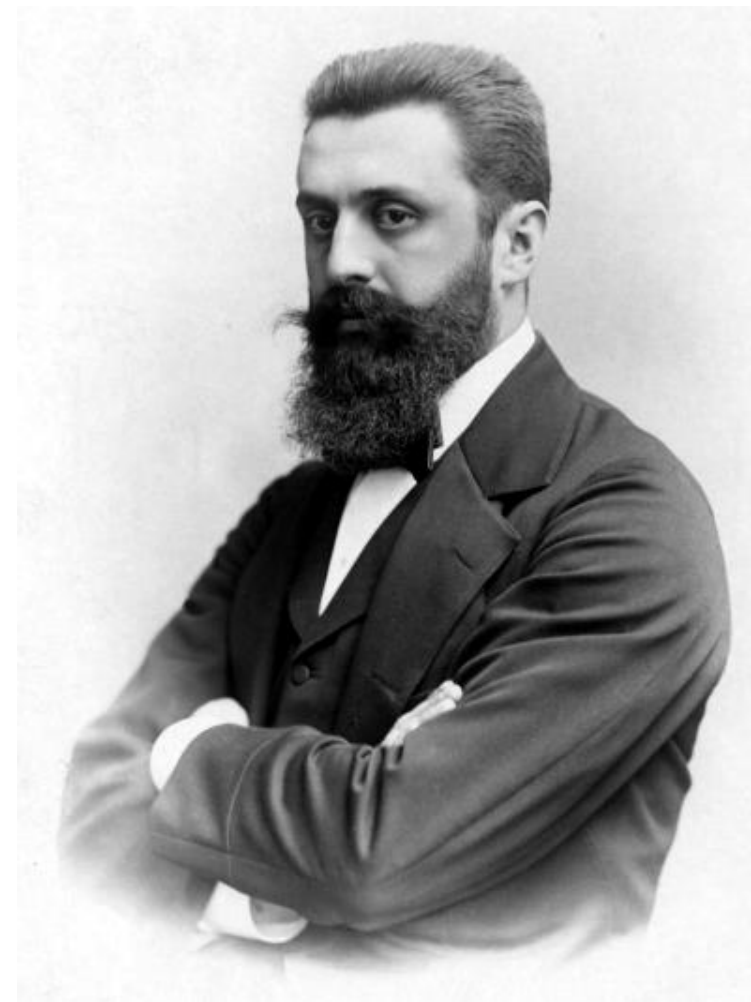
בנימין זאב הרצל 1860-1904