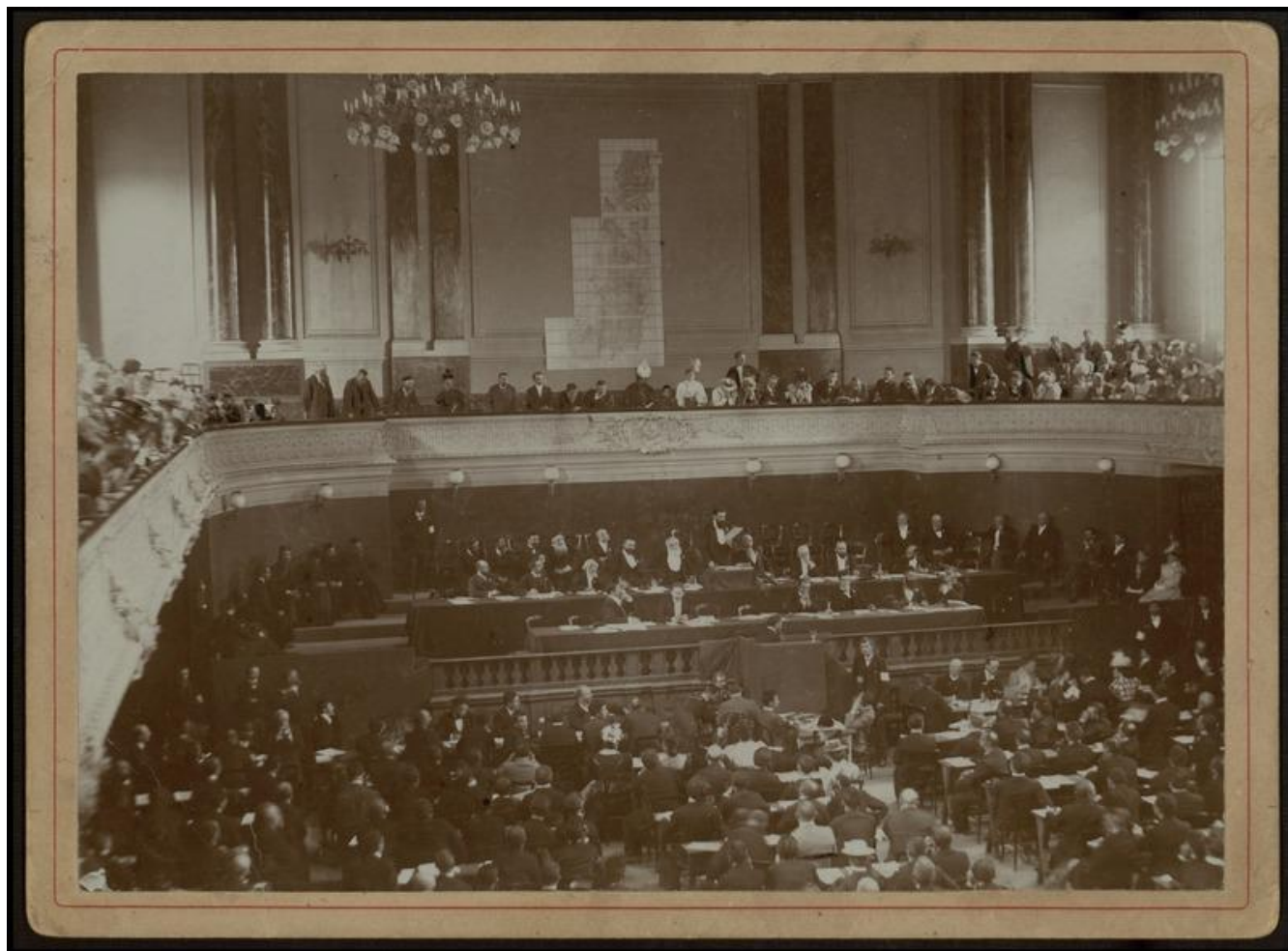
הקונגרס הציוני הראשון בבאזל בשנת 1897